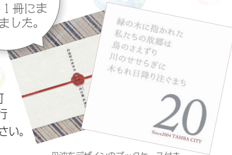
丹波布デザインのブックケース付き

販売場所 総合政策課・植野記念美術館 ※各支所でも6月30日(火)まで購入可 仕様等 A4スクエア 108ページ 550部発行 他 郵送可 詳しくは市のホームページを確認ください。 問 総合政策課 ☎ 82-0916