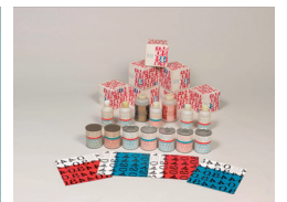
奥田善巳《エヴァの》 紙、プラスチックボトル、缶、 1966年 西宮市大谷記念美術館蔵