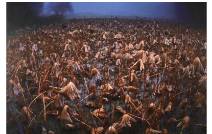
写真部門 大賞 『晩秋の聲』芦田千賀子