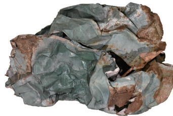
立体部門 大賞 『てっかり』東亨