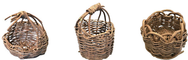
参加者が制作した「つるかご」

2月22日、青垣いきものふれあいの里で、友の会花ごサークルによる「つるのかごづくり講習会」が行われました。参加者たちは柔らかくて編みやすい葛で「素編み」のかごをつくり、「リベンジで参加して満足のいくものができた。また参加したい」と話していました。