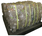
収集したペットボトルのペール（梱包品）

私たちが分別して出したペットボトルは、回収された後、選別・圧縮されてリサイクル工場に運ばれます。工場では、洗浄・破碎をしてペレットと呼ばれる原料に姿を変え、再び新しいペットボトルへと生まれ変わります（水平リサイクル）。私たちの分別が資源を循環する大きな力になっています。