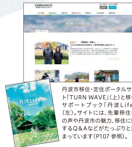
丹波市移住・定住ポータルサイト「TURN WAVE」(上)と移住サポートブック「丹波Life」(左)。サイトには、先輩移住者の声や丹波市の魅力、移住に関するQ&Aなどがたっぷりと詰まっています(P107 参照)。

※「移充」には、移住で暮らしを「移す」だけでなく、移住後の生活を「充実させ」「満たしてほしい」という思いが込められています。