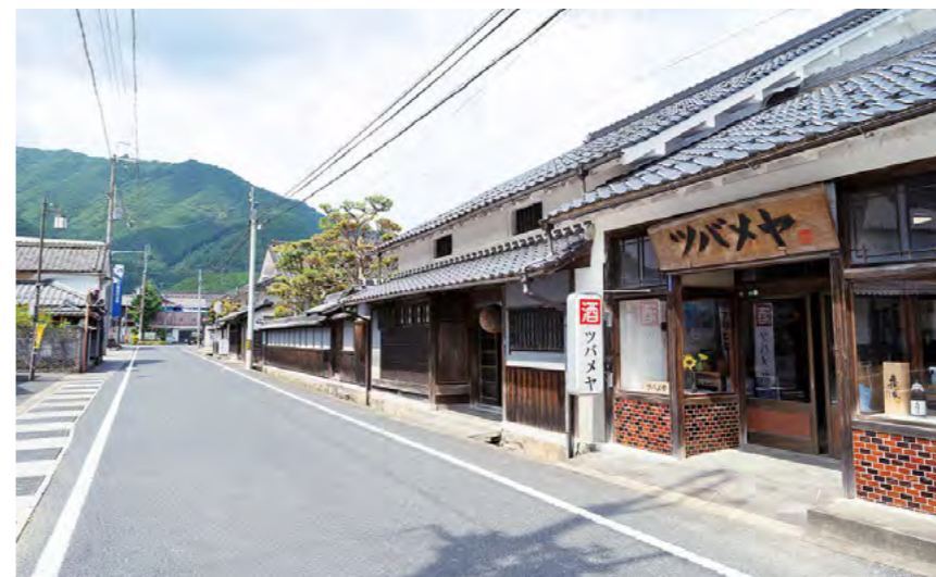
歴史ある建物が残る佐治の町並み