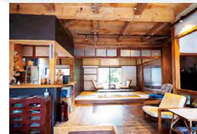
元薬屋の古民家を改修した「センバヤ」は地域の人の居場所