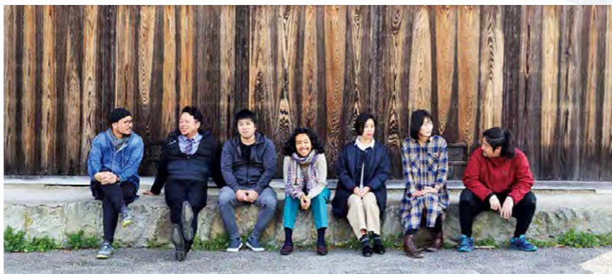
移住者との架け橋 たんば「移充」テラスの相談員

また、丹波市移住・定住ポータルサイト「TURN WAVE」では、移住者のインタビュー記事などを通じて、市民も丹波市の魅力に気付くきっかけとなっています。