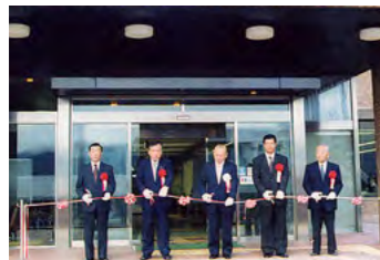
丹波市が誕生、業務をスタート 平成16年11月1日

平成の大合併により氷上郡6町が合併し、県内3番目の合併市として「丹波市」が誕生。本庁舎・春日分庁舎・4支所と1出張所で業務がスタートしました。