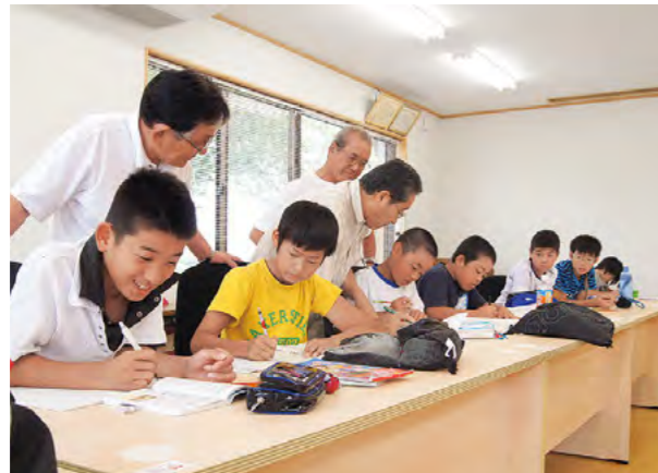
「平成たんば塾」が本格的にスタート 平成23年7月21日

丹波の森公苑で、「夏期巡回ラジオ体操・みんなの体操会」を開催しました。朝6時から3,000人を超える市民がさわやかな汗を流し、NHKラジオで生中継されました。