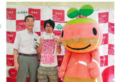
「ちーたんオリジナル ナンバープレート」の交付を開始 平成24年8月7日

原動機付自転車(50CC・90CC・125CC)を対象とした「ちーたんオリジナルナンバープレート」の交付がはじまりました。