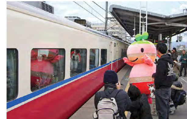
恐竜列車「ちーたん号」で春の京都を満喫