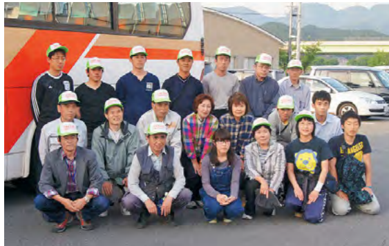
東日本大震災被災地を支援 平成23年5月21日～22日

市民ボランティアが石巻市鮎川地区で災害ボランティアにあたりました。初めてボランティアが入る海沿いの町で、ガレキの撤去や遺留品等の洗浄など、与えられた任務に懸命に取り組みました。