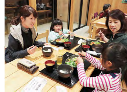
移動型子ども食堂「どんぐり食堂」 平成30年11月28日

春日町野上野の「ゆめの樹」で、だれでも利用できる「どんぐり食堂」が開催されました。食事を通して家庭と地域がつながり、子どもたちを見守る場をつくりたいと、市内の有志によりはじまり、市内の飲食店を借りて実施されています。