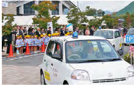
「セーフティーたんば号」出発 平成19年10月15日

市内全小中学校に配備された「セーフティーたんば号」の出発式が、山南住民センター前で開催されました。県警交通機動隊の白バイの先導に続き、32台が青色回転灯を灯しながらパレードへと出発しました。