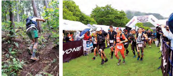
世界屈指の過酷なレース 「TAMBA100アドベンチャートレイル」 令和5年6月2日～4日

丹波の森公苑を発着点として、全長100マイル超の山岳コースなどを制限時間56時間で走る鉄人レースで、国内外から延べ157人が参加し、極限に挑みました。