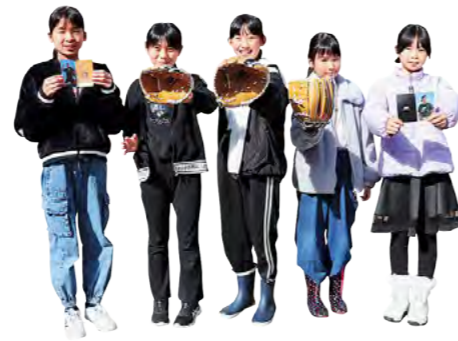
大谷選手からの贈り物 子どもたちにグローブが届く 令和6年1月

丹波の森公苑を発着点として、全長100マイル超の山岳コースなどを制限時間56時間で走る鉄人レースで、国内外から延べ157人が参加し、極限に挑みました。