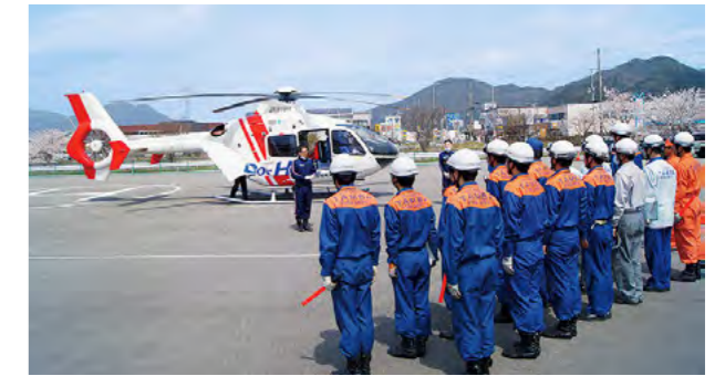
ドクターヘリの運航開始

市内各駅と京都を結ぶ恐竜列車「ちーたん号」を運行し、家族連れなど約300人が列車の旅を楽しみました。市島駅のホームは、「ちーたん」「はばタン」との記念撮影や出発式などでにぎわいました。