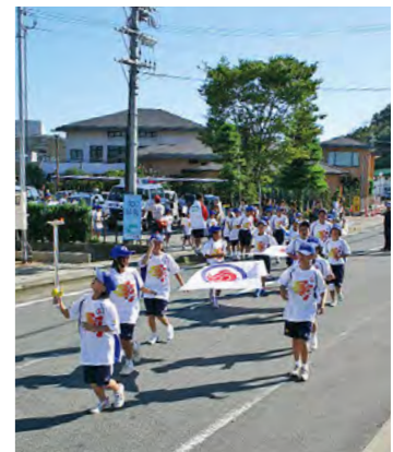
みんなの力が一つになって のじぎく兵庫国体開幕 平成18年9月30日

歌道谷の市公共用多目的用地で、丹波市消防団初出式が開催されました。消防団員らは、式典や行進で決意を新たにしました。