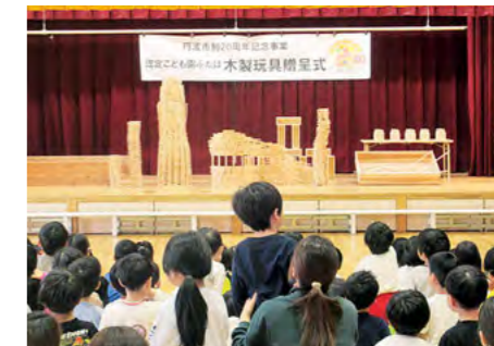
市内の認定こども園などに 木製玩具を贈呈 令和6年11月5日～

中学生向けオリジナルボードゲーム「TMK」の完成披露会が行われました。「高校生が創る丹波の未来への架け橋プロジェクト」のメンバーや愛好家らが、市民の方から地域の課題やアピールポイントを教わり、制作しました。