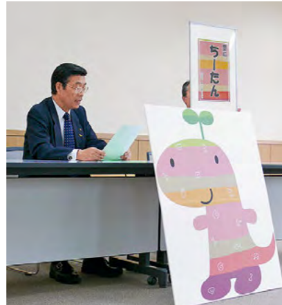
丹波電マスコットキャラクターの愛称とデザインが決定!

市内全小中学校に配備された「セーフティーたんば号」の出発式が、山南住民センター前で開催されました。県警交通機動隊の白バイの先導に続き、32台が青色回転灯を灯しながらパレードへと出発しました。