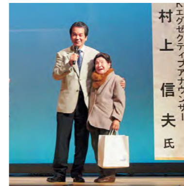
丹(まごころ)の里ありがとう！ 感謝のメッセージ 平成24年3月17日

夏休み期間中、各自治協議会などで「平成たんば塾」が実施され、地域の人々が子どもたちの学習をサポートしました。