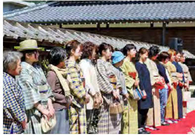
「うづきのうたげ」 丹波布ファッションショー開催 平成29年4月23日

柏原藩陣屋跡で丹波布ファッションショーが開催されました。丹波布の着物を身につけた貴重な姿に、観客からは歓声があがっていました。