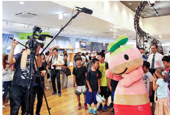
映画「恐竜の詩」エキストラ300人が参加 平成29年8月25日

新品種「丹波白雪大納言」の魅力を市内に伝えるため、市内の和洋菓子店が製作した丹波白雪大納言を使った新商品がお披露目されました。