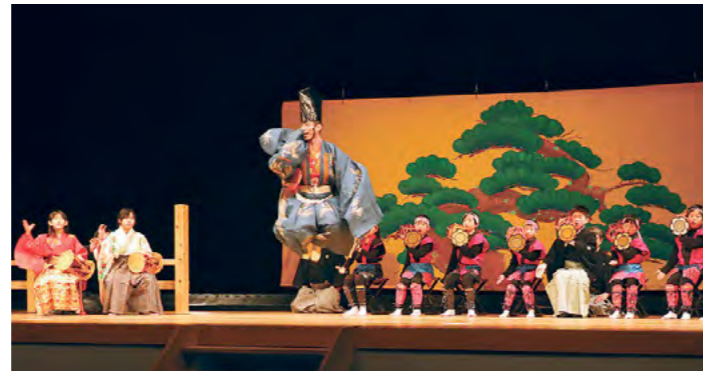
五感で楽しむ歴史文化体感フェスタ 令和6年1月13日

高校魅力化支援事業として、氷上西高等学校に「eスポーツ部」が発足しました。兵庫県内の県立高校では初めての取り組みで、1年生7人で活動を開始しました。