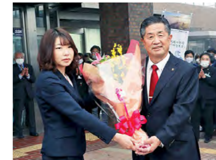
林市政がスタート 令和2年12月5日

旧柏原支所庁舎が「かいばら一番館」としてオープンし、市民や観光客の憩いの場として活用されています。