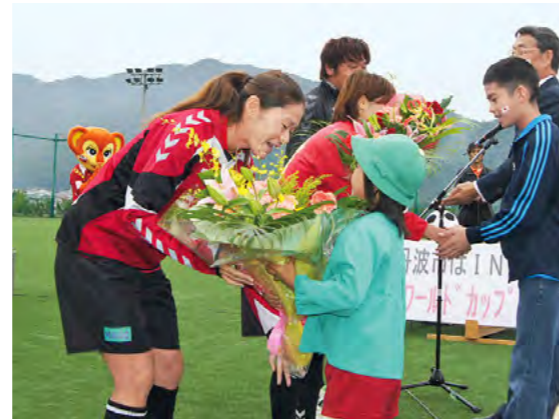
元気をありがとう！ INAC神戸「応援セレモニー」を開催 平成23年10月5日

市民ボランティアが石巻市鮎川地区で災害ボランティアにあたりました。初めてボランティアが入る海沿いの町で、ガレキの撤去や遺留品等の洗浄など、与えられた任務に懸命に取り組みました。