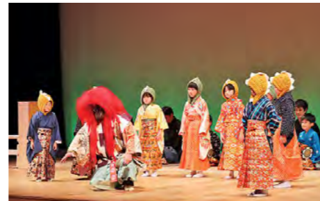
子どもたちが新作狂言に挑戦 令和元年11月29日

認知症高齢者が喫茶店のスタッフとなり、注文を間違えても「だんない(大丈夫)」とあたたかく受け入れて認知症への理解を深めるカフェ「だんない」第1回目が、山南地域で開かれました。