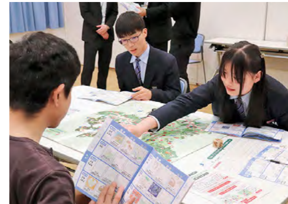
すぐろくで丹波市を探検しながら市の課題を解決 令和6年5月30日

春日文化ホールと春日住民センターで「歴史文化体感フェスタin丹波」が開催されました。丹波っ子による三番叟や、雅楽や香道、丹波杜氏麴文化の体験などが行われ、子どもたちは日本文化の魅力を感じました。