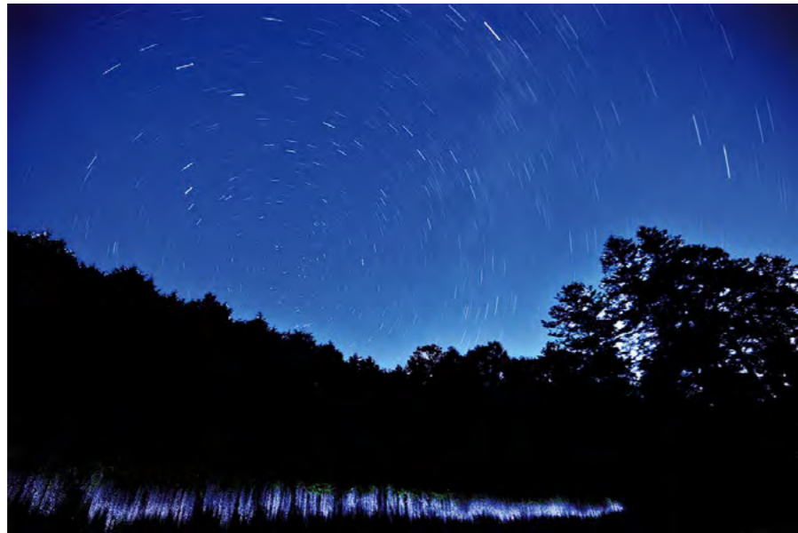
夜空を彩る満天の星とふじの花