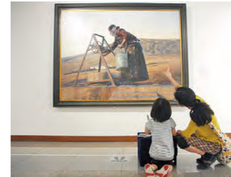
赤ちゃんからの美術鑑賞ツアー 令和元年10月3日

植野記念美術館で「赤ちゃんからの美術鑑賞ツアー」が開催され、親子でゆっくりと展示室をめぐりながら美術館でのひとときを楽しんでいました。