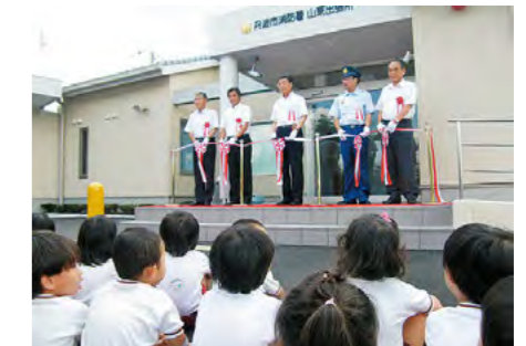
山東地域のいのちを守る出張所が完成

兵庫県、京都府、鳥取県の3府県によるドクターヘリの共同運航がはじまりました。従来の消防防災ヘリは神戸から、ドクターヘリは豊岡から、いずれも約15分で丹波市に到着し、救命率の向上が期待されます。