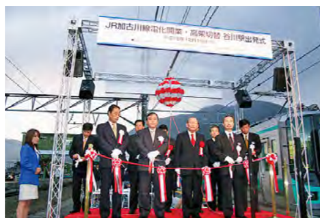
JR加古川線が待望の電化開業 平成16年12月19日

平成の大合併により氷上郡6町が合併し、県内3番目の合併市として「丹波市」が誕生。本庁舎・春日分庁舎・4支所と1出張所で業務がスタートしました。