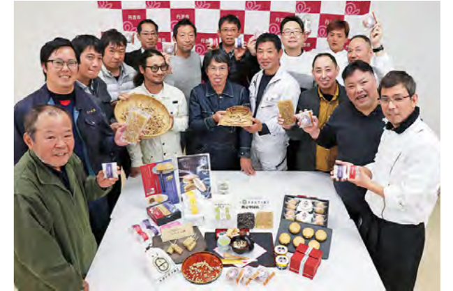
商品開発で魅力を伝える 平成30年11月29日

春日町野上野の「ゆめの樹」で、だれでも利用できる「どんぐり食堂」が開催されました。食事を通して家庭と地域がつながり、子どもたちを見守る場をつくりたいと、市内の有志によりはじまり、市内の飲食店を借りて実施されています。