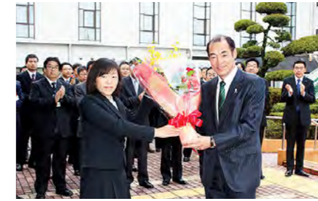
谷口市政がスタート 平成28年12月5日

丹波市郷土民謡保存協会会員約120人が神戸まつりパレードに参加し、フラワーロードから約1kmにわたって丹波市音頭を踊りながら練り歩きました。