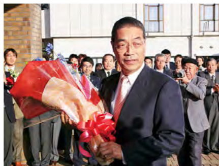
丹波市初代市長決まる 平成16年12月5日

丹波地域と播磨地域をつなぐJR加古川線が電化開業しました。県、JRと沿線各市町が、平成13年度から取り組んできました(総事業費53億3千万円)。