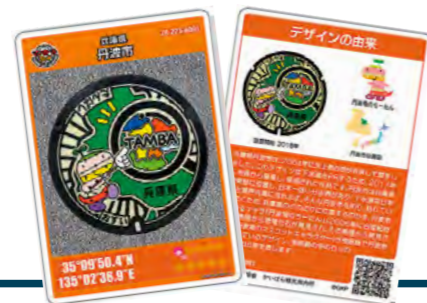
マンホールカードを無料配布 令和元年12月14日

5期目となる丹波市長選挙が11月15日に行われ、林時彦市長(66)が誕生しました。「誇りを持って『帰ってこいよ』と言えるまちの実現」に向けて、林市政がスタートしました。投票率65.35%