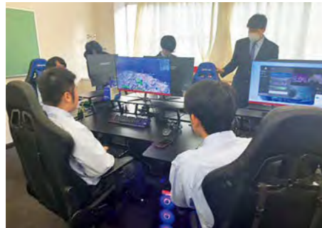
県立高校で県内初！ 氷上西高等学校に「eスポーツ部」発足 令和5年12月4日

市内で活躍する市民やグループの取り組みをメディアに発表する場として、市民プラザで「みんなの定例記者発表」が行われました。高校生や看護師らが、企画しているイベントなどについて発表しました。