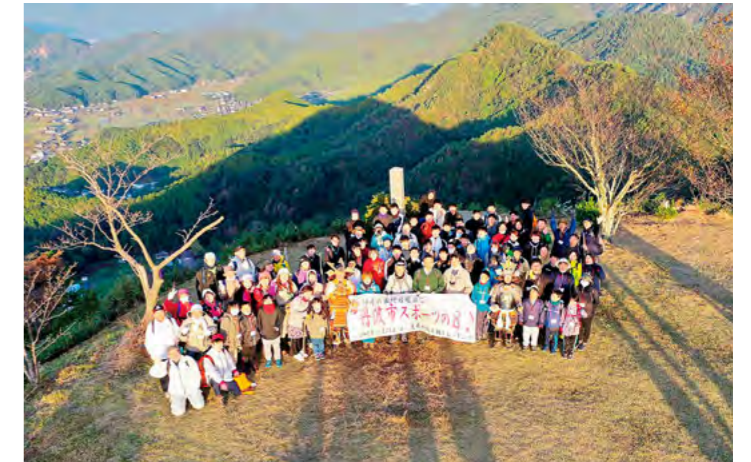
丹波市スポーツの日「黒井城跡早朝トレッキング」 令和2年10月25日

植野記念美術館で「赤ちゃんからの美術鑑賞ツアー」が開催され、親子でゆっくりと展示室をめぐりながら美術館でのひとときを楽しんでいました。