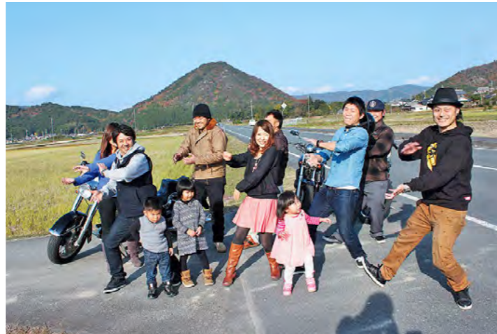
市民800人が「恋チュン」で元気と魅力を発信！ 平成25年12月7日

丹波竜化石工房「ちーたんの館」で、公用車「ちーたん号」がお披露目されました。認定こども園みつみの園児たちがお祝いに駆けつけ、ちーたんと一緒に新車両のデビューをお祝いました。