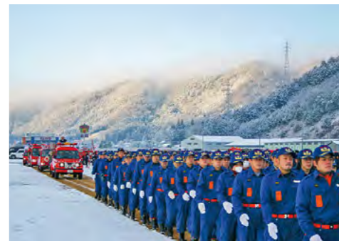
雪の中で 丹波市消防団初出式を開催 平成18年1月8日

丹波市と篠山市(現・丹波篠山市)を結ぶ新鐘ヶ坂トンネルが開通し、開通式典が行われました。古くから交通の難所で、明治、昭和のトンネルに続く3代目のトンネルとして、約10年をかけて完成しました(総事業費約78億円)。