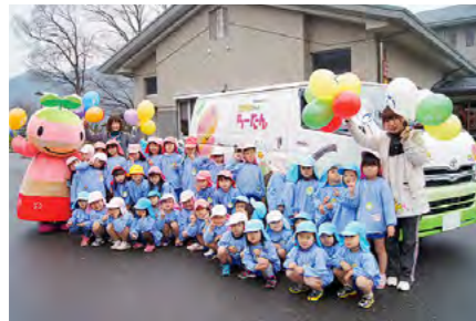
走る広告塔「ちーたん号」発車！ 平成25年3月28日

4期目となる丹波市長選挙が11月20日に行われ、谷口進一市長(63)が誕生しました。「住みたい、帰りたい、トカイナカ。丹波市」をめざして、谷口市政がスタートしました。投票率68.04%