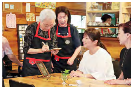
注文をまちがえる喫茶店 「だんない」 令和元年7月10日

市では、毎年10月最終日曜日を「丹波市スポーツの日」と定めています（平成24年～）。小学生を含む51人の参加者たちが、午前4時30分に市役所春日庁舎を出発して黒井城跡山頂に到着し、みんなで日の出を楽しみました。