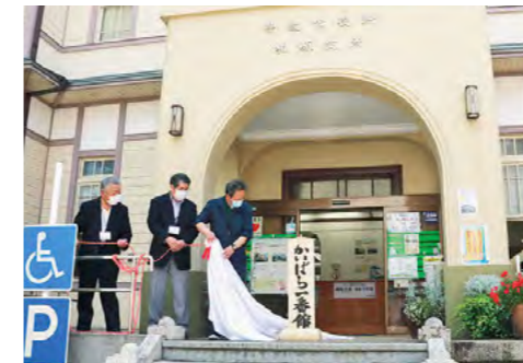
「かいばら一番館」がオープン 令和2年6月2日

春日文化ホールで、丹波市創生シティプロモーション支援事業「第1回新丹波猿楽座特別公演」が行われました。新作狂言「ちーたんと丹波竜」には地域の子どもたちも出演し、会場を沸かせました。