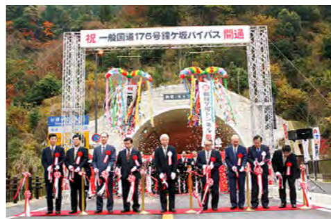
「平成のトンネル」 新鐘ヶ坂トンネルが開通 平成17年11月27日