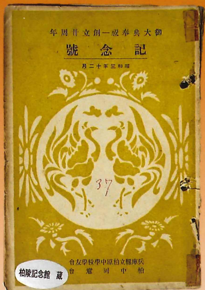
『学友会誌』第37号（昭和3年12月発行） 兵庫県立柏原高等学校蔵