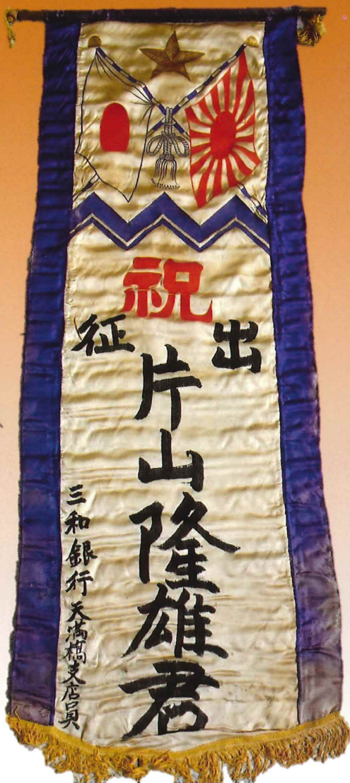
片山桃史出征旗（昭和12年頃）