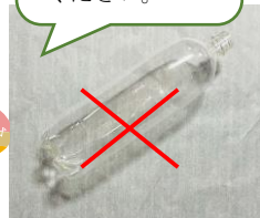
ペットボトル本体