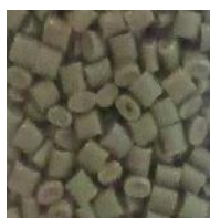
ペレット (合成樹脂)

みんなが分別したプラスチックごみは、リサイクル業者に引き渡し、そこで粉碎、洗浄し再生原料 (ペレット) となってプリンターや建築資材など新しい製品に生まれ変わります。