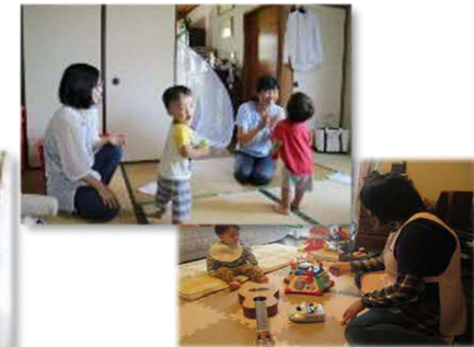
育児支援のイメージ