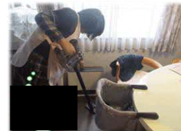
家事支援のイメージ