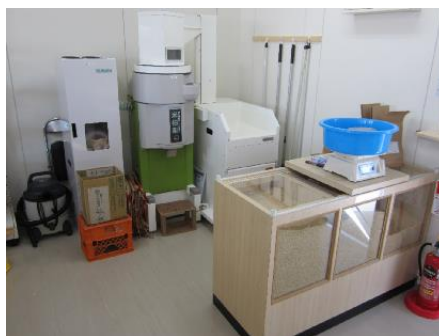
精米器と販売ケース