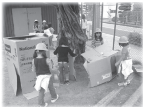
秘密基地をつくろう！（中央小）

「おっちゃん、また来てよ！」「また、今度な…」と言われるだけでうれし（地域アドバイザーから）