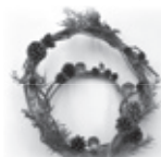
自然素材をつかったリース

FAT 事業を通して、自然の恵みにふれ、感謝し、ふるさとを大事にする心が育っていくことを願っています。