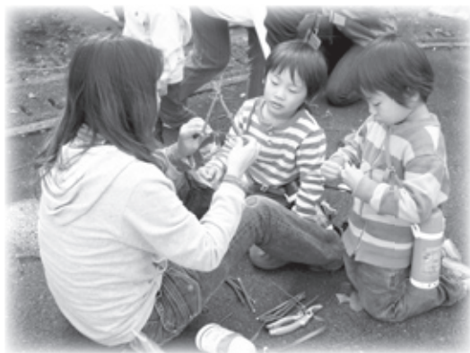
木切れでフォトスタンドをつくろう！