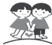
人権啓発コーナー