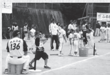
ふるさとボールパーク事業