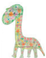
優秀賞 辻野博貴 （山南町玉巻・13歳）