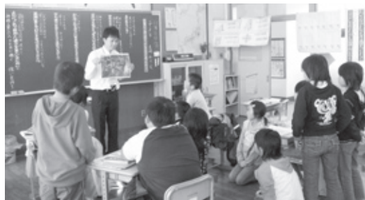
進修小学校 授業風景