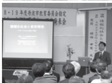
青垣中学校 講演会

進修小学校では、11月9日に「伝え合う楽しさがわかる進修っ子をめざして」をテーマに、「聞き合い、話し合い、高め合う授業の取り組み」についての授業公開と実践発表を行いました。また、青垣中学校でも11月20日に「自ら学び、心豊かに、たくましく生きる生徒の育成」をテーマに、コンピュータなどの情報機器をつかった授業公開と実践発表を行いました。