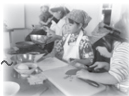
みんな夢中！ LET' S クッキング！

ファミリーアクショントライ事業（FAT 事業）では、五感を使って自然にふれ、季節の移り変わりを家族や地域住民といっしょに感じながら楽しく学びあっています。例えば、“春と秋の親子自然散策”では、お母さんやお父さんも参加し、家族や地域住民といっしょに散歩しながら、道端の草花や木の実にふれ、それらの名前を覚えたり遊んだりして自然を満喫。拾ったどんぐりや松ぼっくりで、すてきなリースもつくりました。また、“おやつづくり”や“親子クッキング教室”では、親子でいっしょにつくることの楽しさや食べることの喜びを味わいました。家であまりお手伝いをしない子も、好き嫌いのある子も、自分でつくったおやつや食事は特別なものの