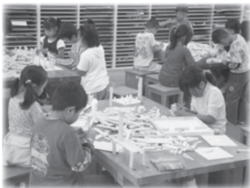
なにをつくろうかな？（大路小）