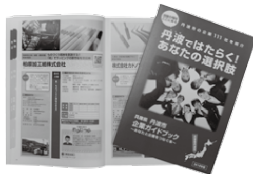
企業ガイドブック

市内の企業 111 社の情報をまとめた「丹波市企業ガイドブック 2018 年版」を作成しました。市内で就職したい、どのような会社があるのか知りたいなど、就職活動をしている人向けのガイドブックです。ホームページにも掲載しています。