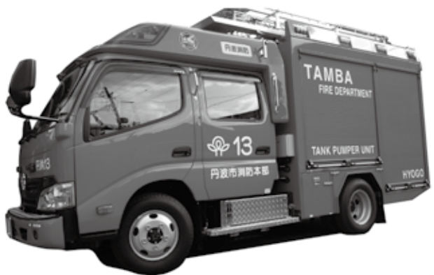
山東地域配備の新規購入消防ポンプ自動車

子供たちが病気にかかっています。さらに、世界では90秒に1人が水に関連した病気で亡くなっているとも言われています。日本の水道水は、飲用しても問題がないよう殺菌消毒をして各家庭に送られており、安全です。しかし、世界では多くの人が安全な水を飲めません。 蛇口をひねるといつでも水が出て、いつでも飲むことができますが、水は限りある資源です。節水を意識し、水道の出しっぱなしに気を付けるなど、大切に使いましょう。