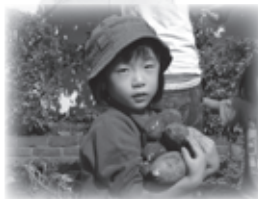
さつまいも たくさん とれたよ