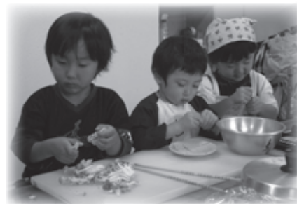
しめじやこんにやくと奮闘中