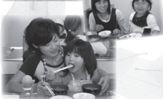
おいしいね～もりもり食べます