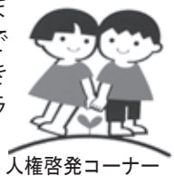
人権啓発コーナー

欧米では父親と子どもの過ごす時間が、1日平均概ね1時間に対して、日本では25分程度です。反対に、母親が育児や家事に費やす時間は、約7時間30分になっています。日本では父親は仕事に多くの時間を費やし、母親は家事や育児に多くの時間を費やす。つまり父親と母親のバランスが極端な国とも言えます。これは、母親や子どもにとっても幸せなことではありません。そのように働かざるをえない現在社会のシステムに問題があります。それらを当たり前とするのではなく、より豊かな生き方や働き方をしようとするのがワークライフバランスであると言えます。