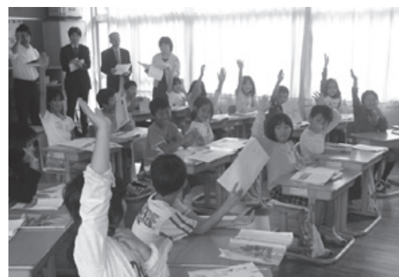
北小学校の研究授業

教育委員会では、学力調査の結果などを踏まえた実践的研究、食育や小学校外国語活動に関する研究など、学力の確実な定着を図る指導方法の工夫改善をめざして「新・学び合い大好き事業～学びがつながる丹・ぱりゅうプランの展開～」を実施しています。