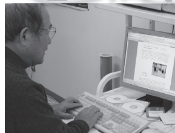
「地区のみなさんに読んでいただくことを楽しみに、毎月里新聞を手づくりしています」