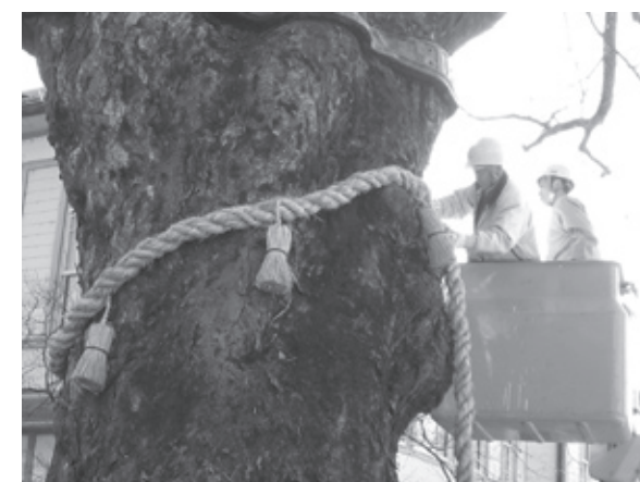
長さ11メートル、太さ40センチ、重さ約30キロの巨大しめ縄。わら100束を使って4人がかりで1週間かけて編みあげられました。

11月26日から12月14日まで植野記念美術館で開催した「ちーたん仲間たち展」には、市内の小学校をはじめ市内外からのたくさんの来館者でにぎわいました。展示会では、丹波竜のマスコットキャラクターとして誕生した「ちーたん」をはじめ、全国から応募のあった1,441点の作品すべてを展示しました。また、県立柏原高校の美術部員による「ちーたん」と原始人の顔の部分が切り抜かれたパネルも初登場。写真を撮る親子連れの姿がたくさんありました。