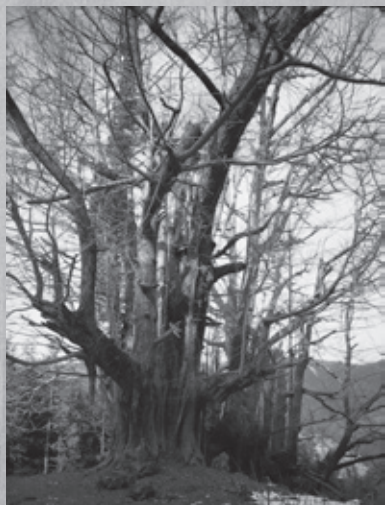
まちを歩けば 写真で見える文化財④名勝・天然記念物編 常龍寺の大イチョウ（青垣町）

青垣町大名草の常龍寺裏山を30分ほど登った山腹の標高約400m付近に、イチョウの大木がある。ここには戦国時代ごろまでお堂があったが、兵火にあって寺は山裾に下り、イチョウだけが当時のまま残っている。中国原産の木。このイチョウの親木（主幹）の樹高は28.5m、幹周り10.9mを誇り、県内はもとより近畿でも最大のイチョウである。親木からは多くの枝が伸び、その枝からは気根がぶら下がり、地元では「乳の木」として親しまれている。親木は、落雷のため中が空洞となっているが、気根から根となり新たな命を得た子木2本がそれぞれ幹周り3mを越す大きさに育っている。親木だけでなく、子木も大樹となって命が受け継がれていく様子を目の当たりにすると、自然の力強さを実感できる。平成14年4月9日、県の天然記念物に指定された。