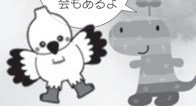
コウノトリのコーちゃん 丹波竜のちーたん

詳しくは、NHK神戸放送局ホームページ http://www.nhk.or.jp/kobe/ をご覧ください。