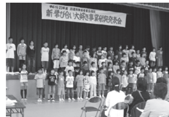
遠阪小学校の研究発表

テーマ：「つたえあう力を高める児童の育成」 国語科・算数科を中心に、自分の考えをより分かりやすく相手につたえあう授業をめざし、公開授業と研究発表を行いました。