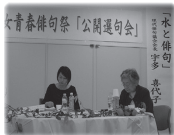
俳句の解説を織り交ぜながら和やかな雰囲気での公開選句会。