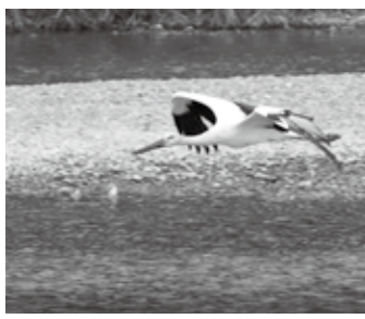
市内に飛来したコウノトリ

のモチベーションが高まっていることです。 さらに、これから北近畿豊岡自動車道が北伸し、丹波と但馬の時間距離がどんどん短縮されていきます。インバウンドをはじめ、観光客を誘致する兵庫県の施策は「神戸↓姫路城↓城崎温泉」の3点を結ぶトライアングルになるでしょう。 城崎温泉に来た観光客を、さらに養父・朝来・丹波・篠山へと、懐かしい日本の農村・里山風景に誘うことはできないものか。その際に通過する春日ICや道の駅「おばあちゃんの里」は限らない可能性があるのではないかと感じワクワクします。 観光施策の大転換期が来る予感がしています。