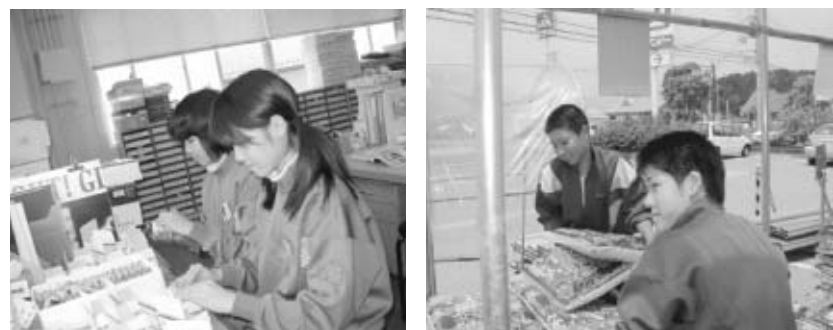
製品の箱詰め作業