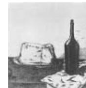
駒井哲郎「帽子とピン」 会期 7月30日まで

丹波市氷上町西中615-4 開館時間 / 午前10時から午後5時(月曜日休館) ☎ 0795-82-5945 入館料 / 大人500円、学生300円、小・中学生200円 (ココロカード利用可、20名以上団体割引)