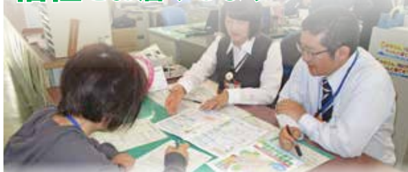
☎ 地域包括支援課（春日庁舎内） ☎ 74 - 0368

「地域包括支援センター」は、高齢者の皆さんが、住み慣れた地域で自分らしい生活を送ることができるよう総合的に支援する機関です。主任ケアマネジャー・保健師・社会福祉士が連携し、他の機関と協力しながら問題解決に向けて支援します。介護に関する相談や悩み以外にも、福祉・医療に関することなど、何でもご相談ください。