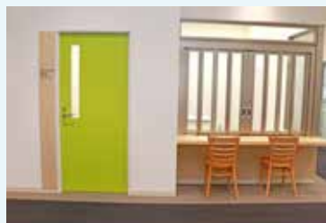
男女共同参画センター受付