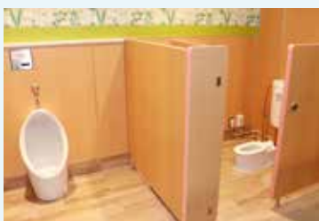
子ども用のトイレ