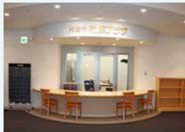
市民活動支援センター受付