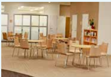
オープンスペース・貸出図書