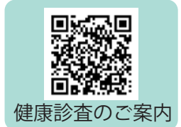
健康診査のご案内