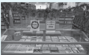
中央図書館の展示コーナー

認知症はだれもがなりうるもので、周囲の理解や環境が整うことで自分らしい生活を続けることができます。市では、より多くの人々が認知症への理解と関心を深められるよう、市内商業施設での啓発活動やオレンジライトアップ、認知症に関する書籍の展示コーナー設置などの取組を行います。問 介護保険課（本庁第2庁舎内） ☎ 88 - 5267