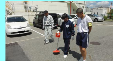
金属探知機を使っている様子