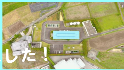
この写真は中学生が実習でドローンを操作し、上垣浄水場（市島）を撮影したものです。

どのような施設がどんな役割をもっているのかや、どんな水道の仕事があるのかがわかりました。「すごいなあ」と思うこともたくさんありました。中でも24時間対応ができるような体制を整えることがすごいと思いました。他にも難しいと思うこともあり、良い経験になりました。