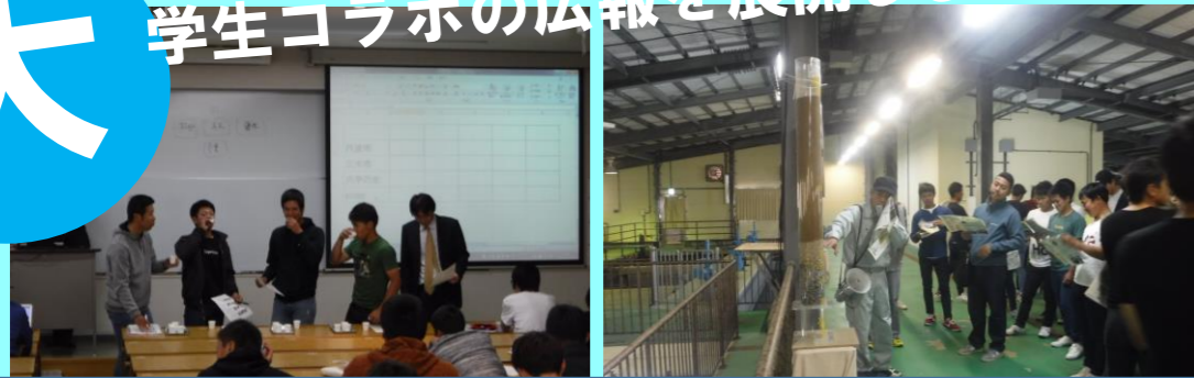
【左の写真】 大学で水道の講義を行い、利き水を実演している様子