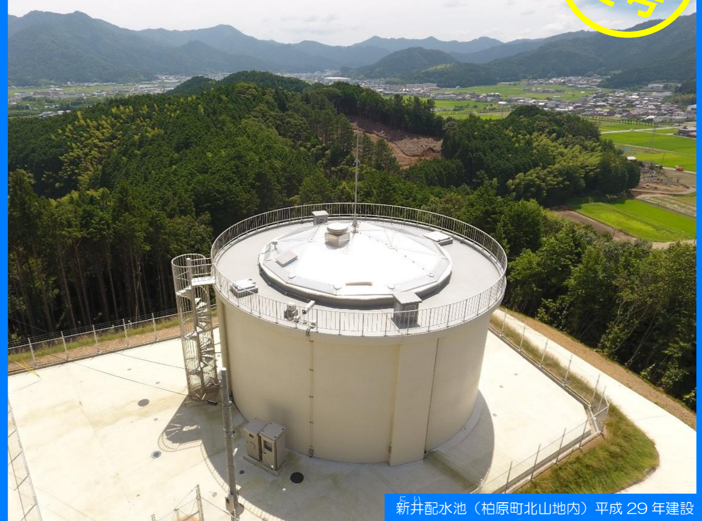
新井配水池（柏原町北山地内）平成 29 年建設