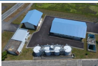
山南浄水場 (H22 年度建設) ・浄水能力 3900 m 3 /日

山南地域では、浄水場 2 箇所、配水池 11 箇所、水源 (井戸) 5 箇所、加圧ポンプ場 11 箇所が稼働しています。