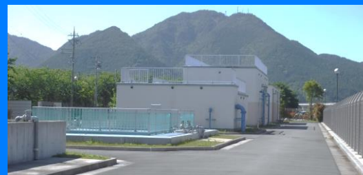
採水場所 氷上中央浄水場

水道施設の平準化や効率化を目指し進めてきた水道施設統合整備事業が完了し、市内における水道水の安定供給の基盤が整いました。 これを契機とし、さらに水道水がおいしい水であることを実感してもらい、積極的に飲み水として利用していただくことを促進するため、このたび「丹(まごころ)の水」と銘打って水道水によるボトルウォーターを製造しました。 ラベルもデザインも一新し、丹波市の PR 活動にも活用していきます。