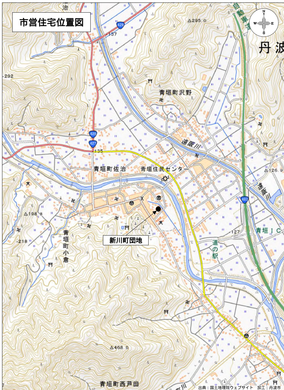
名称：丹波市市営住宅新川町団地 位置：丹波市青垣町佐治344番地