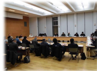
第4回検討委員会（全体会） (令和8年2月10日19時50分～)