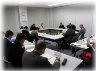
第3回黒井・船城地域部会 (令和8年2月10日19時～)