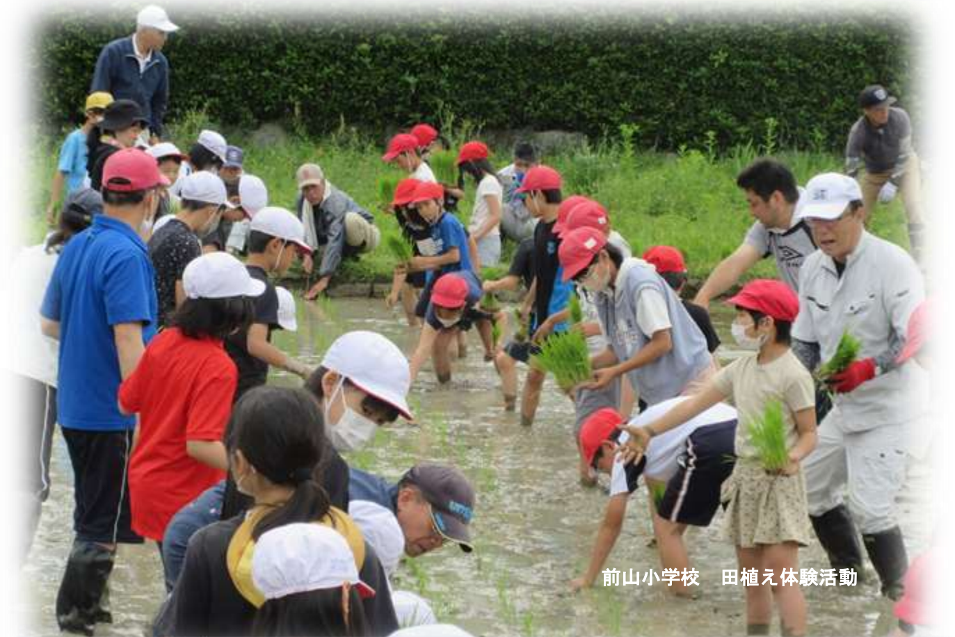
前山小学校 田植え体験活動