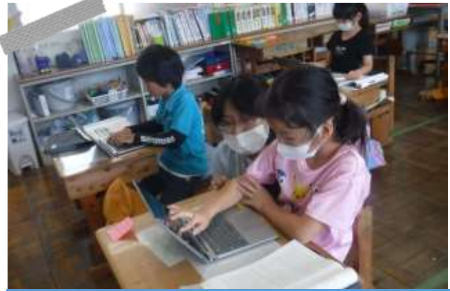
竹田小学校 学生ボランティア学習支援