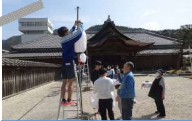
柏原中学校 ひな巡り