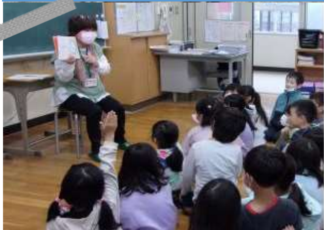
崇広小学校 読み聞かせ