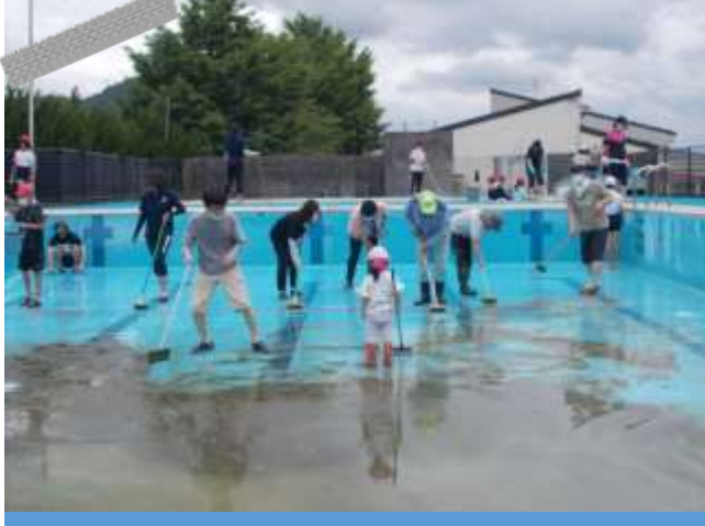
船城小学校 プール掃除