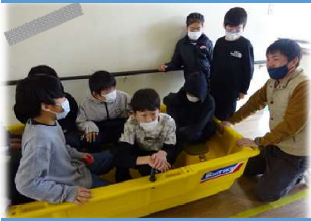
南小学校 防災教室