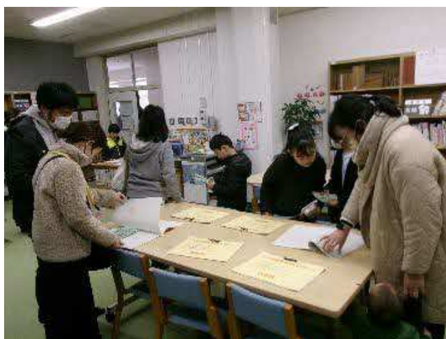
図書室の構想 （イメージ図面）