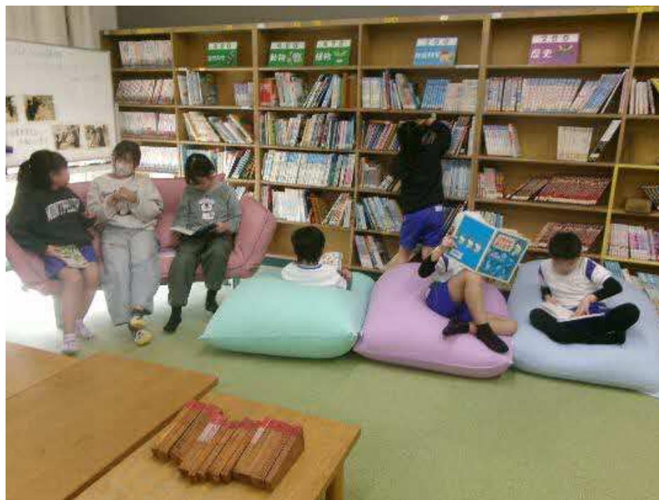
丹波市立春日部小学校