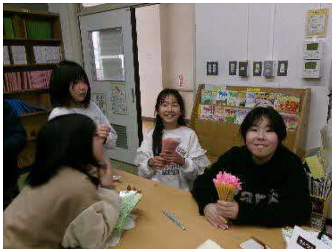
オープン記念しおり