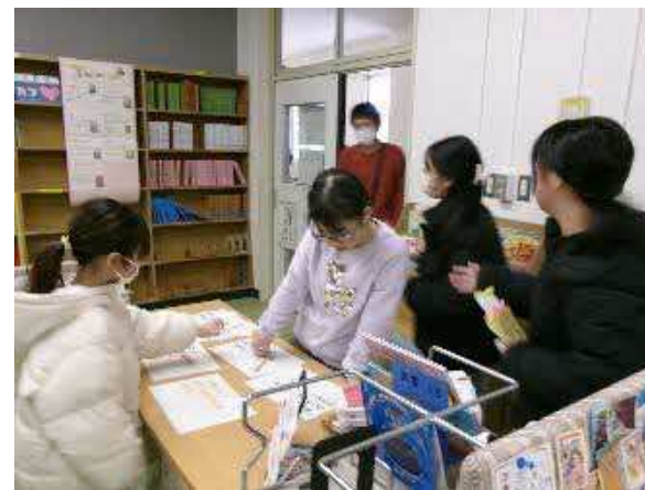
オープン記念イベント 「うさぎが出てくる本を探せ！！」