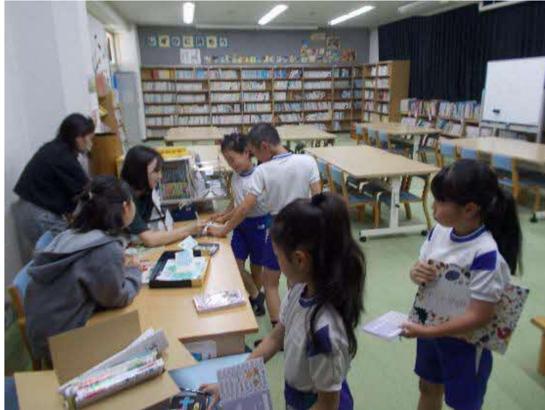
丹波市立春日部小学校