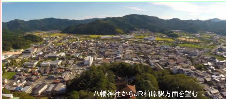
八幡神社からJR柏原駅方面を望む