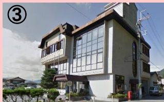
旧柏原町商工会館

旧柏原町商工会跡を、シェアオフィスなどインキュベーション施設としてリノベーションを行う。起業者支援拠点として、相談窓口機能を充実させるほか、専門家による支援を実施するなど、起業者のワンストップサービスの拠点として充実を図る