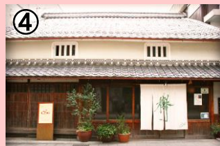
(株)まちづくり柏原が経営するレストラン「オルモ」

(株)まちづくり柏原が主体となって取り組んでいる中心市街地内の空家・空地を活用したテナントミックス事業を引き続き実施する。