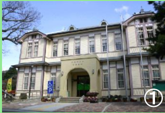
観光機能を充実する柏原支所