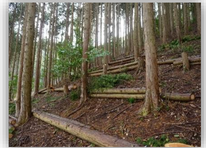
間伐木を利用した表土流出対策 (簡易土留工)