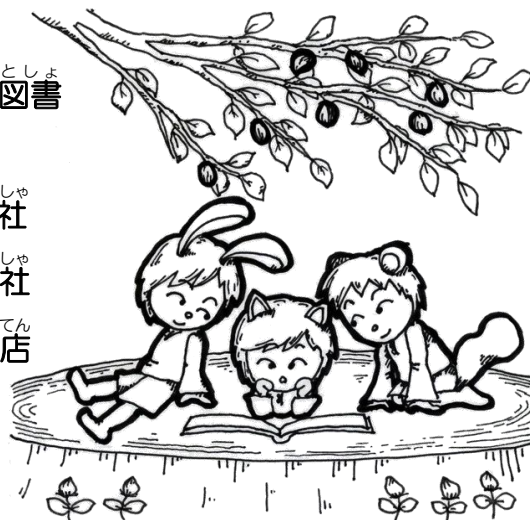
イラスト：大西 万実 平成25年4月 丹波市立図書館 / 発行

『ももいろのきりん』 なかがわ りえこ 中川 李枝子 / さく なかがわ そうや 中川 宗弥 / え 福音館書店