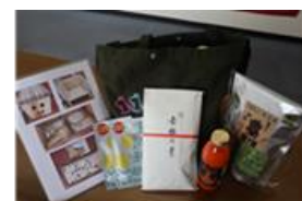
ハッピーバースバック イメージ