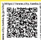
illustration & design : Norie Ikegami

お問合せ 丹波アートコンペティション実行委員会事務局 丹波市まちづくり部文化・スポーツ課内