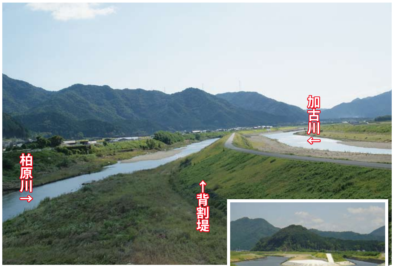
△ 稻継樋門(上流)から撮影